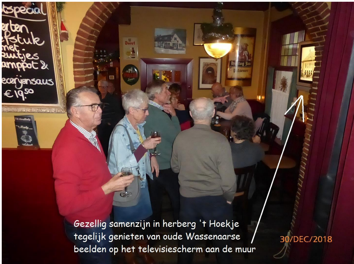
Gezellig samenzijn in herberg 't Hoekje tegelijk genieten van oude Wassenaarse beelden op het televisiescherm aan de muur