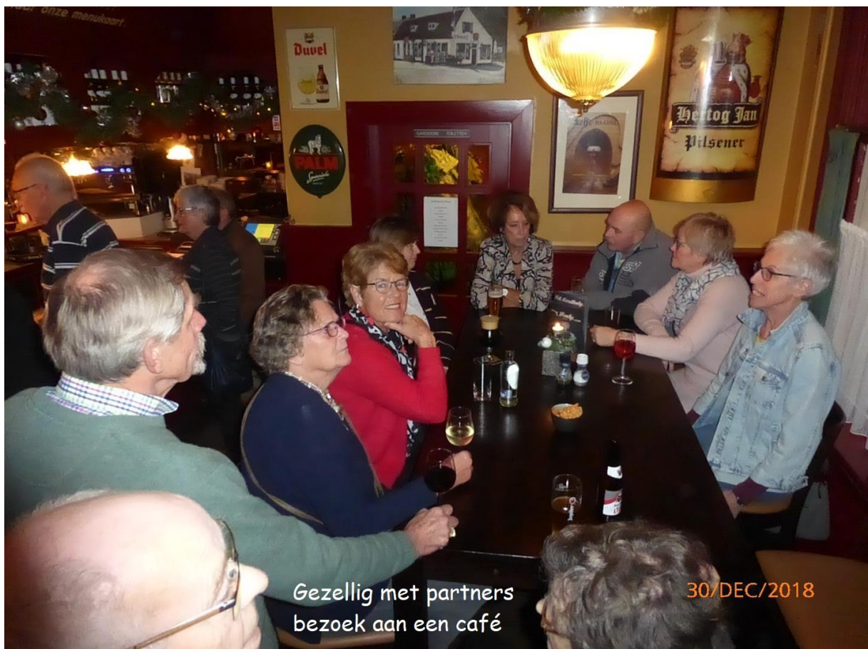
Gezellig met partners bezoek aan een café