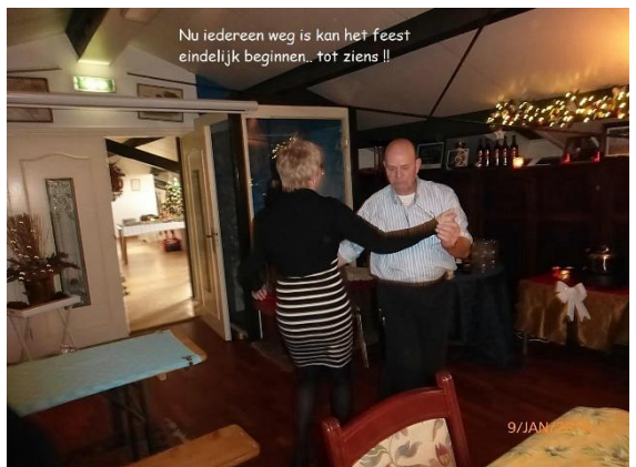
Nu iedereen weg is kan het feest eindelijk beginnen... tot ziens !!