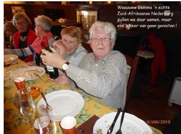
Waaaauw Gemma 'n echte Zuid-Afrikaanse Nederburg zullen we daar samen, maar een lekker van gaan genieten !