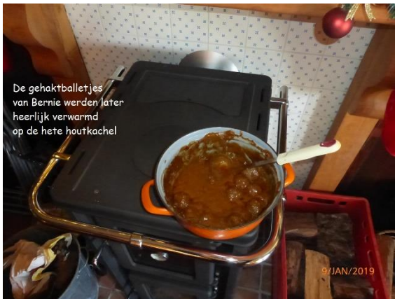
De gehaktballetjes van Bernie werden later heerlijk verwarmd op de hete houtkachel