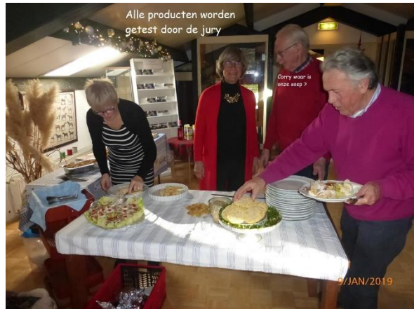
Alle producten worden getest door de jury