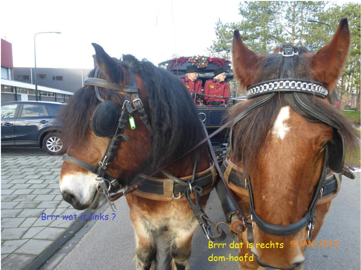
Brrr wat is links ?