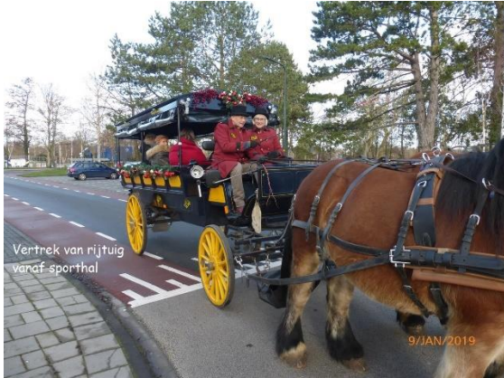
Vertrek van rijtuig vanaf sporthal